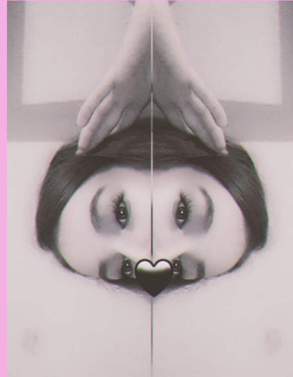
Eines meiner Bilder.