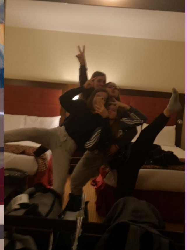
Das sind unsere Photos.